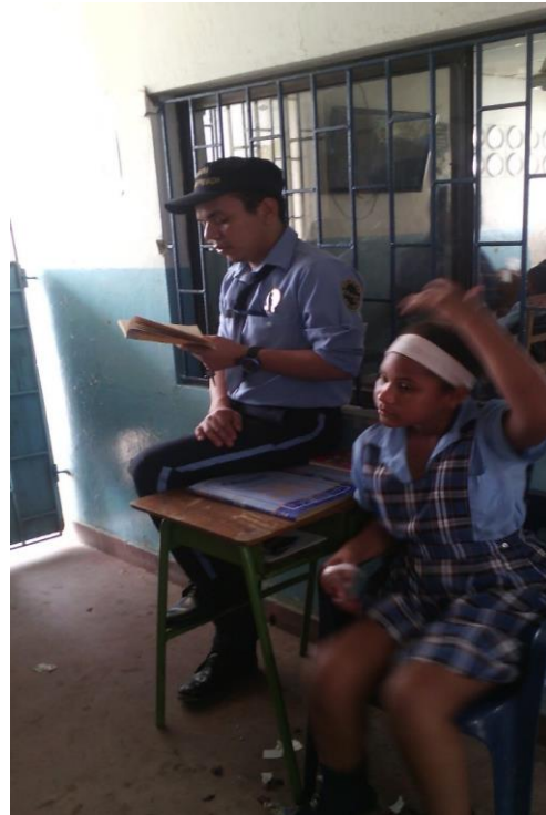
Figura 4. Estrategia “La tienda del libro”.