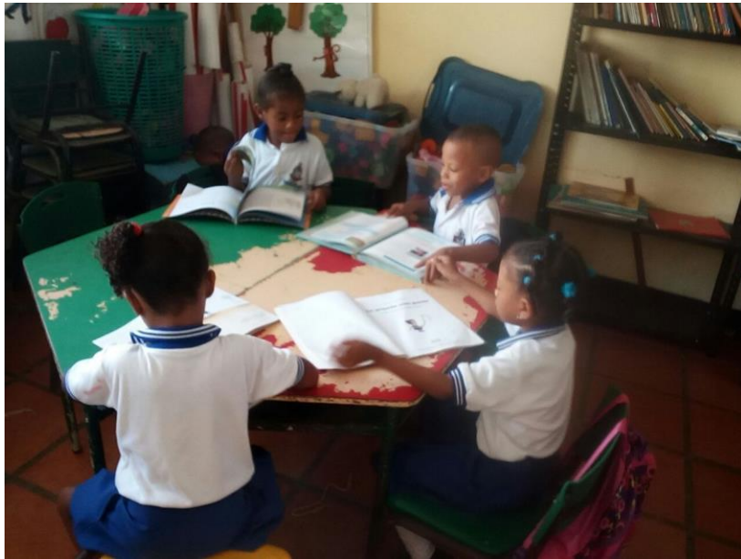
Figura 8. Lectura en el aula con estudiantes de preescolar