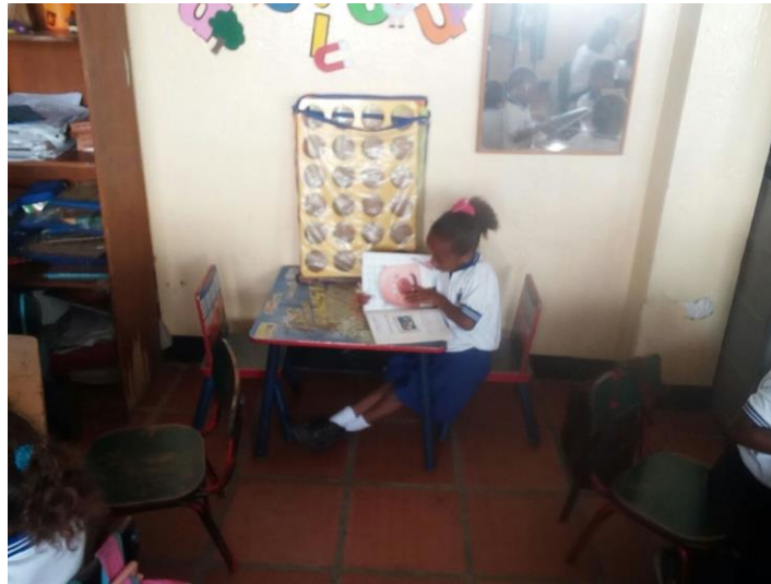
Figura 12. Para leer, ellos eligen el texto y el lugar.