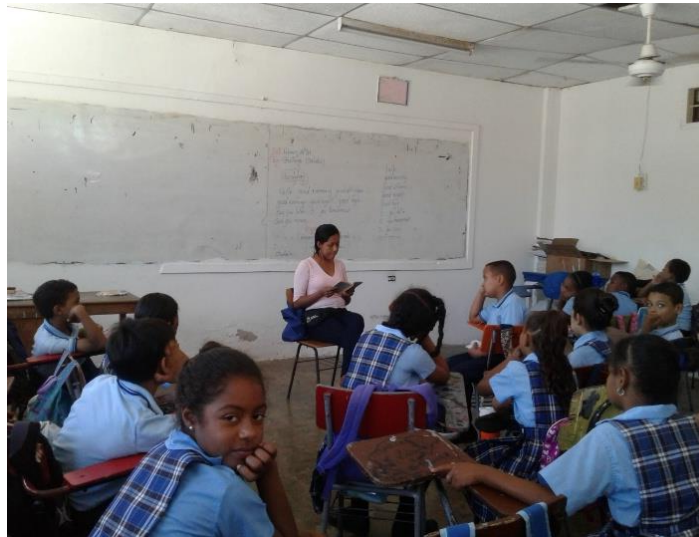
Figura 2. Lectura durante el descanso