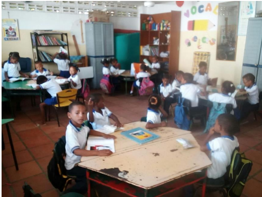
Figura 10. Organizando los libros después de la lectura.