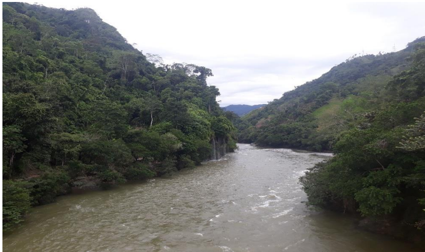
Figura 2. Puerto Garza noviembre 2017

Se encuentra a 148 km desde la ciudad de Medellín, a unas 6 horas aproximadamente debido al mal estado de las vías terciarias para llegar al corregimiento (Wikipedia, s.f.).