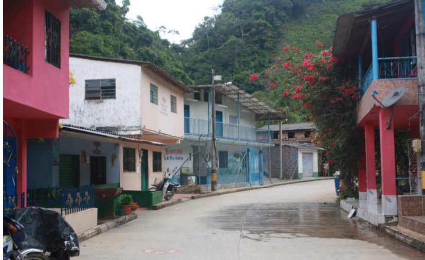
Figura 3. Pueblo puerto Garza noviembre 2017

Nota: Fuente: equipo de investigación USB