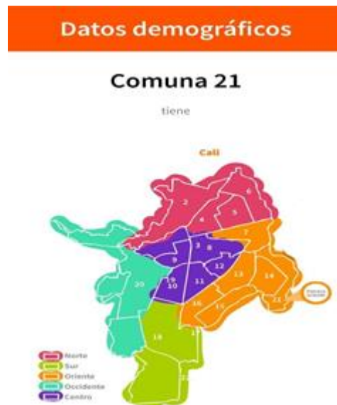
Figura 1 Ubicación del Tecnocentro

Nota. Fuente http://www.somospacifico.org . Datos demográficos de la comunidad