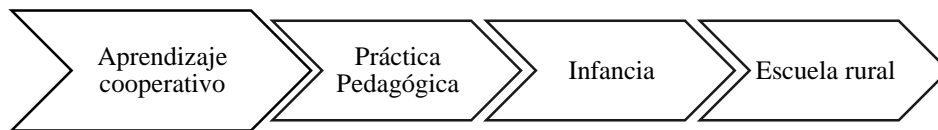
Figura 1 Categorías de investigación

A continuación, se presentan conceptualmente las categorías principales que orientan la investigación, las cuales son: aprendizaje cooperativo, escuela rural, infancia y práctica pedagógica; desde diversos autores creando un diálogo con su postura que aporta significativamente para el proceso de la investigación.